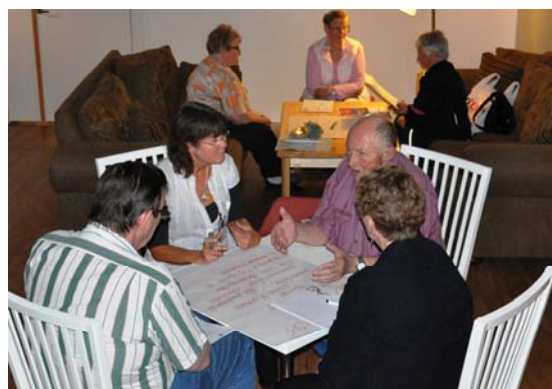
Två grupper som arbetar fram handlingsplaner. Kan det handla om att "Hålla landskapet öppet" och "Fixar Malte".

VAR: Hembyggs lag, byaråd med stöd av kommun och länsstyrelse