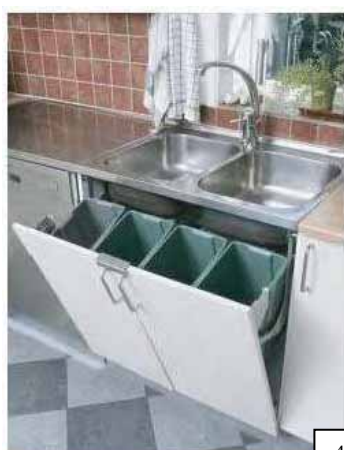
När luckorna tippas framåt lyfts kärnen upp till bekväm nivå.