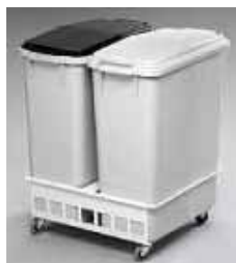
Under skrivbordet - behållare på hjul