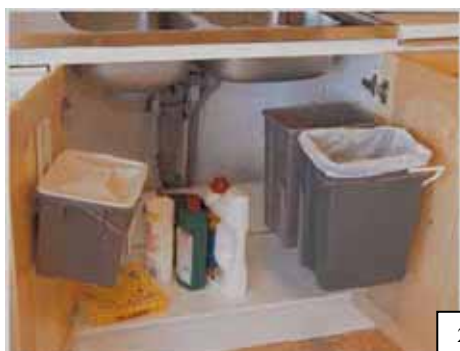
Rullsystem fäst i sidovägg