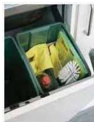
Även diskutrustningen på bekväm höjd.