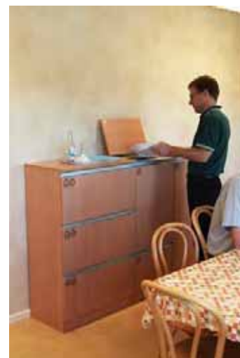
Fika- och lunchrum