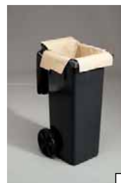
Vagn för 45 liter