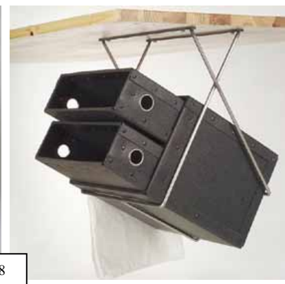
Med extra påse för komposterbart avfall