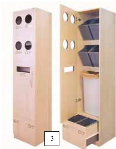
Möbler på höjden