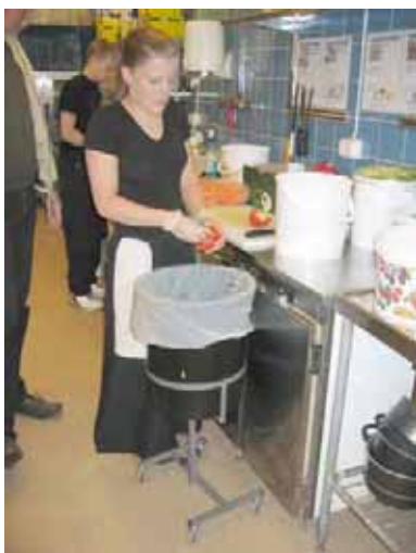
Matavfall, påsar & kärl

Följande sidor gör inga anspråk på att vara heltäckande, har ni fler tips på utrustning som bör vara med, hör av er: avfallsinfo@mora.se , 0250-262 09