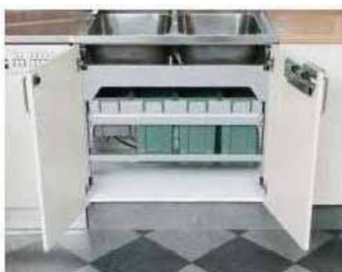
När luckorna öppnas på normalt vis når man lätt den fria golvytan.