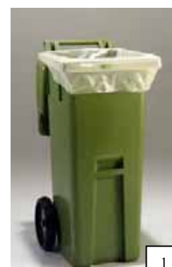
Rullstativ 37 lit