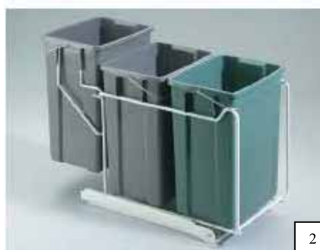
Rullsystem fäst i skåpgolvet